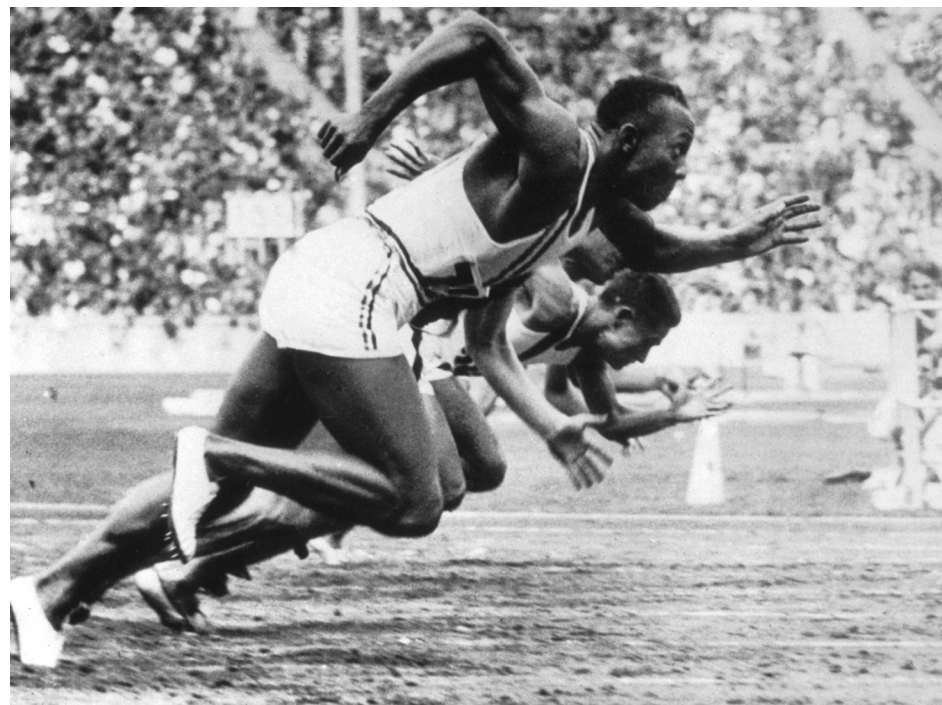
Jesse Owens aux Jeux Olympiques de Berlin en 1936.